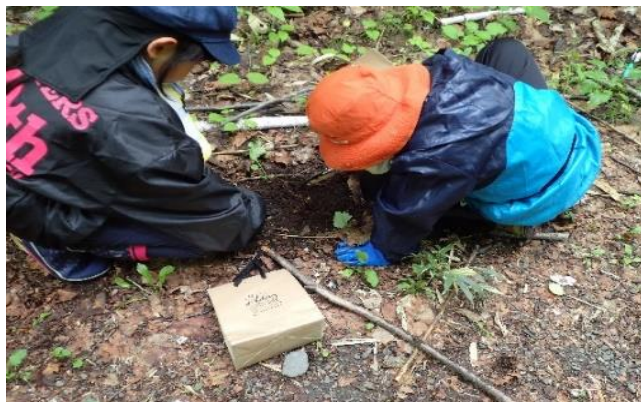
（冬虫夏草は土の中に）