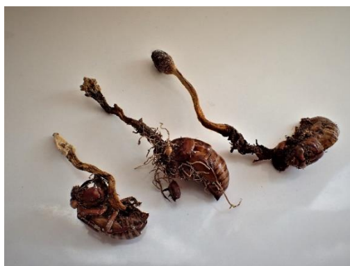
冬虫夏草エニワセミタケ

上記の注意事項と主催者の指示を厳守して頂くことが参加の条件ですが、故意に違反者は参加をお断りします。