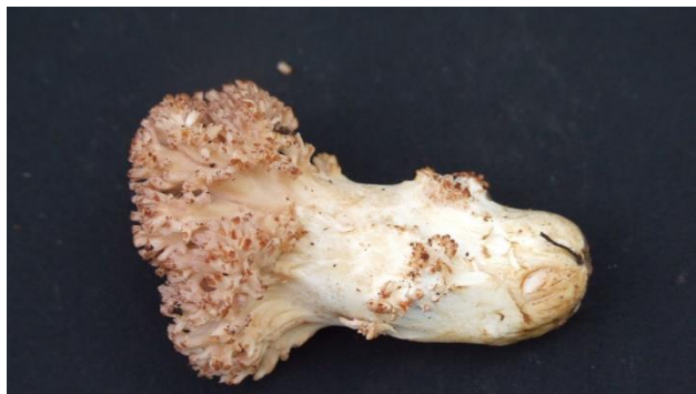
桜山で発見された新種のホオキタケ、 （保護対象希少キノコ）仮称サクラヤマホオキタケ