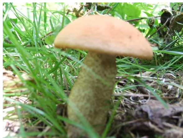
キンチャマイグチ（食）