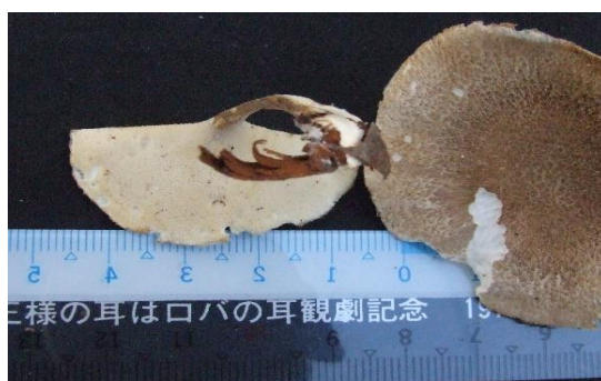
桜山で発見された日本新産種(菌学会発表) エゾノアミスギタケ (命名札幌キノコの会)

札幌キノコの会ホームページ http://sapporo-kinokonokai.com